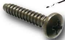
Schraube 4,8 x 25 mm