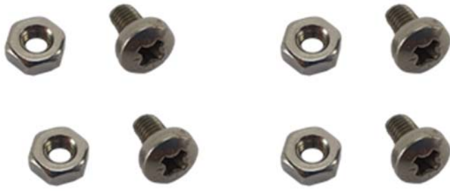
4 x Edelstahlschrauben mit Mutter M3 x 5mm