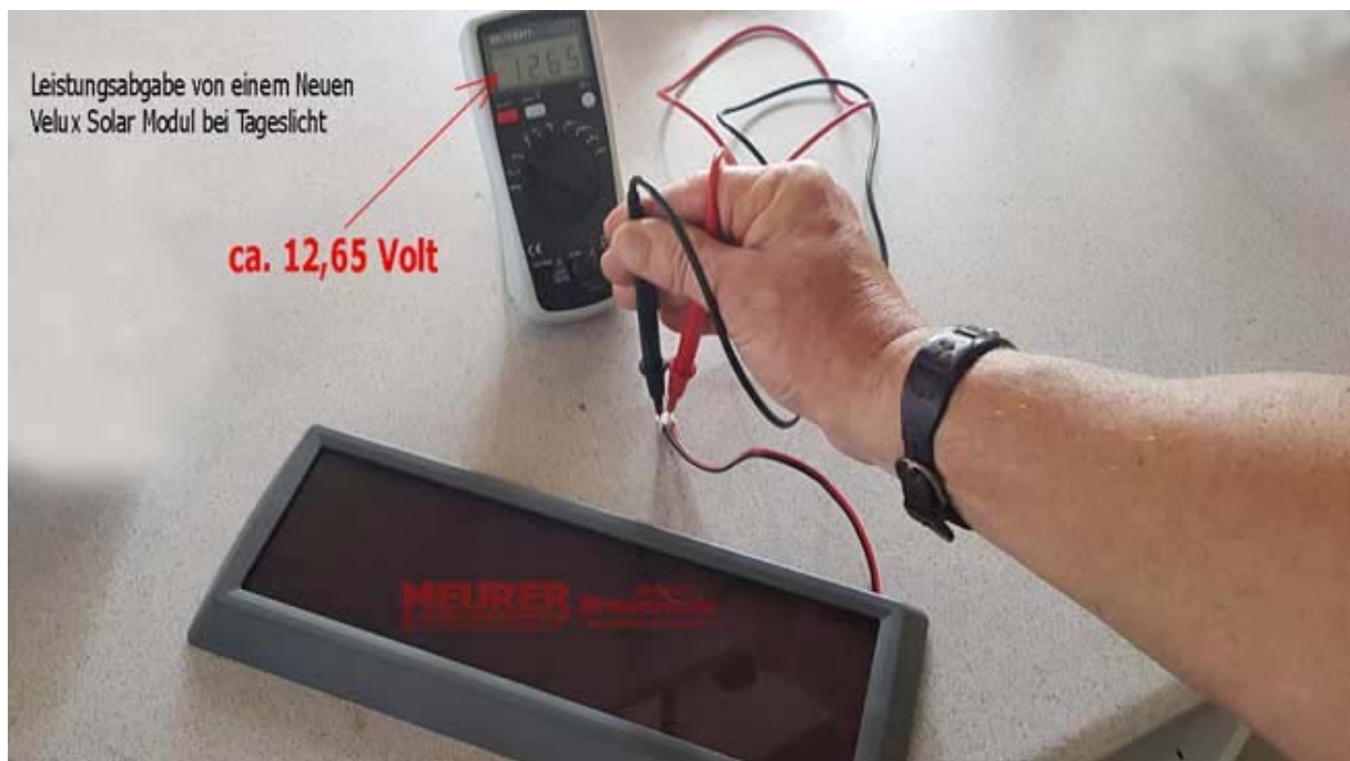
Leistungsabgabe von einem Neuen Velux Solar Modul bei Sonneneinstrahlung